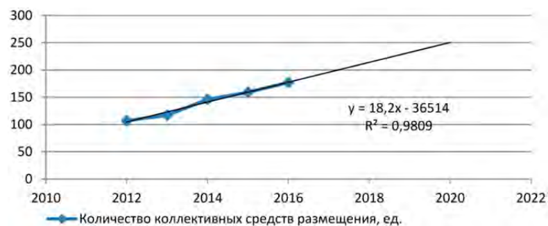
Рис. 4. Динамика изменения количества коллективных средств размещения в Пензенской области за период 2012–2016 гг. и прогноз на 2017–2020 гг., ед. (составлено авторами)