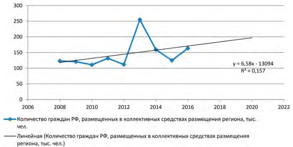
Рис. 2. Динамика изменения численности граждан РФ, размещенных в коллективных средствах размещения Пензенской области за период 2008–2016 гг., и прогноз на 2017–2020 гг., тыс. чел. (составлено авторами)