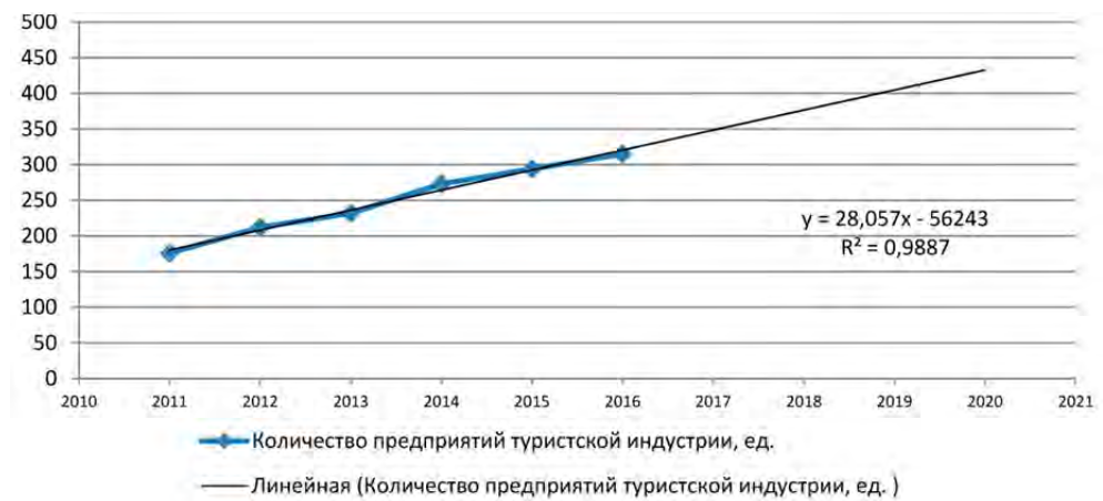
Рис. 3. Динамика изменения количества предприятий туристской индустрии в Пензенской области за период 2011–2016 гг. и прогноз на 2017–2020 гг., ед. (составлено авторами)