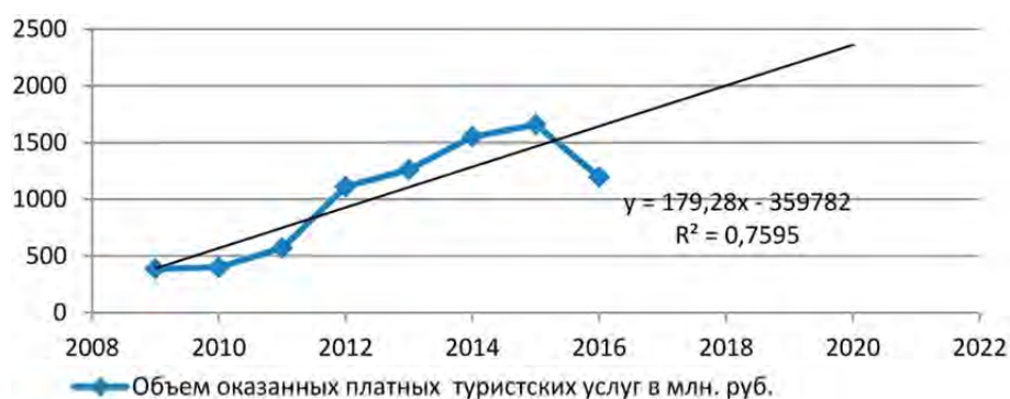
Рис. 5. Динамика изменения объема оказанных платных туристских услуг предприятиями Пензенской области за период 2009–2016 гг. и прогноз на 2017–2020 гг., млн руб. (составлено авторами)

В табл. 4 представлены результаты сравнительного анализа прогнозных значений, полученных авторами, и значений индикативных показателей, указанных в Стратегии развития внутреннего и въездного туризма на территории Пензенской области на период до 2020 г. и «Дорожной карте» развития внутреннего и въездного туризма в Пензенской области на 2015–2020 гг.